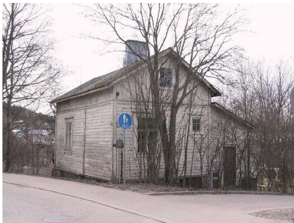
Kyy 101 : 550 Saunasaarencatu 10 luoteesta Anu Eerikäinen