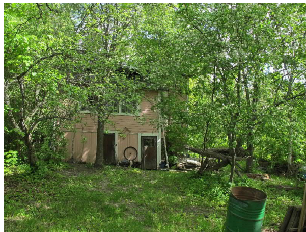
Kyy 101 : 551 Saunasaarencatu 10 pihaa etelästä